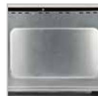
Bombatura posteriore per maggiore volume interno Rounded cavity for more cooking volume

Capacity: 28 liters Convection Inner light 6 cooking functions Suitable for 31cm diameter dish