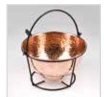
Capacità 3.8L per 2/6 persone Capacity 3.8L for 2/6 persons