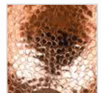
Paiolo in Rame martellinato, diametro: 24.5cm Copper pot, diameter: 24.5cm

Paiolo in Rame martellinato Funzionamento automatico Per 2/6 persone