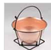
Capacità 5,3L per 4/10 persone Capacity 5,3L for 4/10 persons