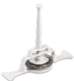
Frustino a movimento magnetico