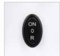
ON/OFF e funzione Reverse ON/OFF and Reverse function