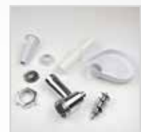
Completamente smontabile per una pulizia più accurata Fully dismantlable for easy cleaning