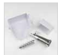
Accessorio passapomodoro Tomato juicer Accessory