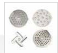
Lama in acciaio inox, 3 trafilie in acciaio inox Stainless steel blade, 3 Stainless steel discs