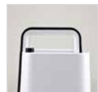
Comoda maniglia e piedini antiscivolo Handle and antislip feet