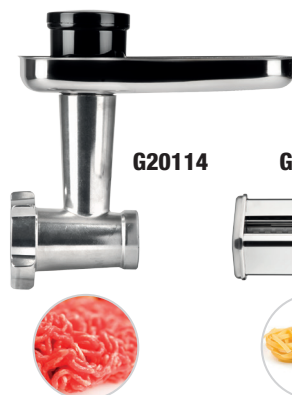
TRITACARNE / MEAT GRINDER Struttura in alluminio, 3 dischi di taglio in acciaio inox