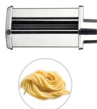
SPAGHETTI / SPAGHETTI MAKER Struttura in acciaio inox, dimensione rullo 14cm

Impastatrice planetaria - Stand mixer ACCESSORI OPZIONALI - OPTIONAL ACCESSORIES