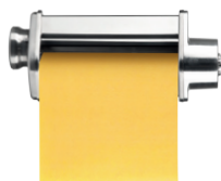
TIRAPASTA / PASTA MAKER Struttura in acciaio inox, 9 regolazioni di spessore, dimensione rullo 14cm