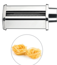
TAGLIATELLE / FETTUCCINE MAKER Struttura in acciaio inox, dimensione rullo 14cm