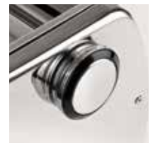
7 regolazioni di spessore