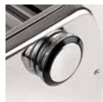
7 regolazioni di spessore