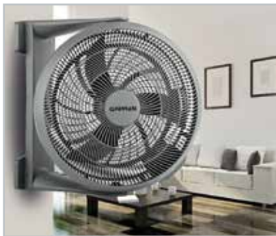
Montaggio a parete / Wall mounting