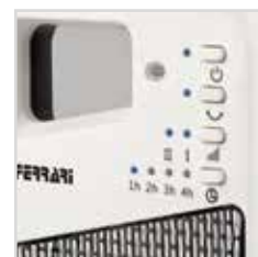
Controllo elettronico Timer 10 H Electronic control Timer 10H