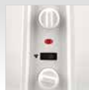
Termostato, 3 potenze