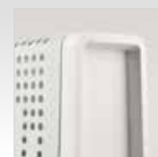
Pratiche maniglie per il trasporto