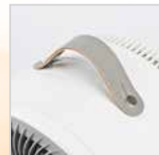
Pratica maniglia in pelle