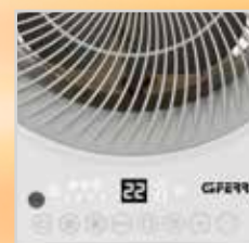
Pannello comandi digitale