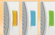
Indicatore luminoso caldo/freddo/Eco