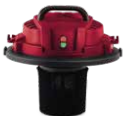
FILTRO IN SPUGNA